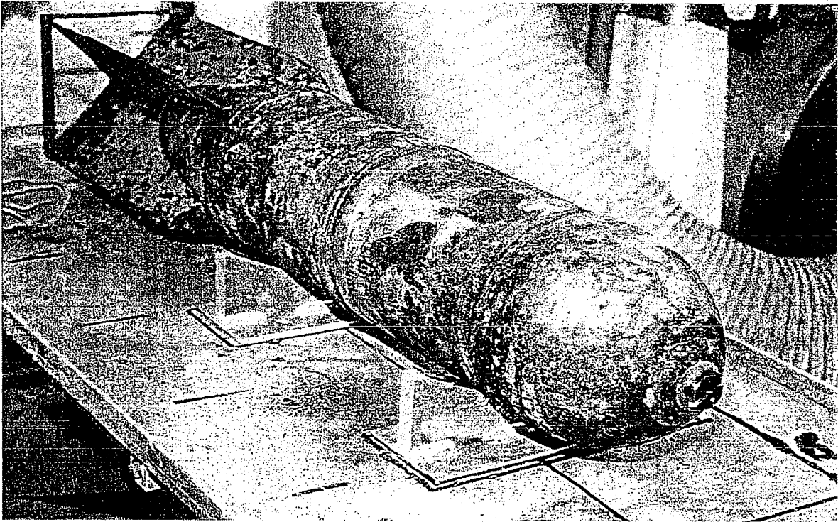
写真1 屈斜路湖より回収された50kg投下きい弾