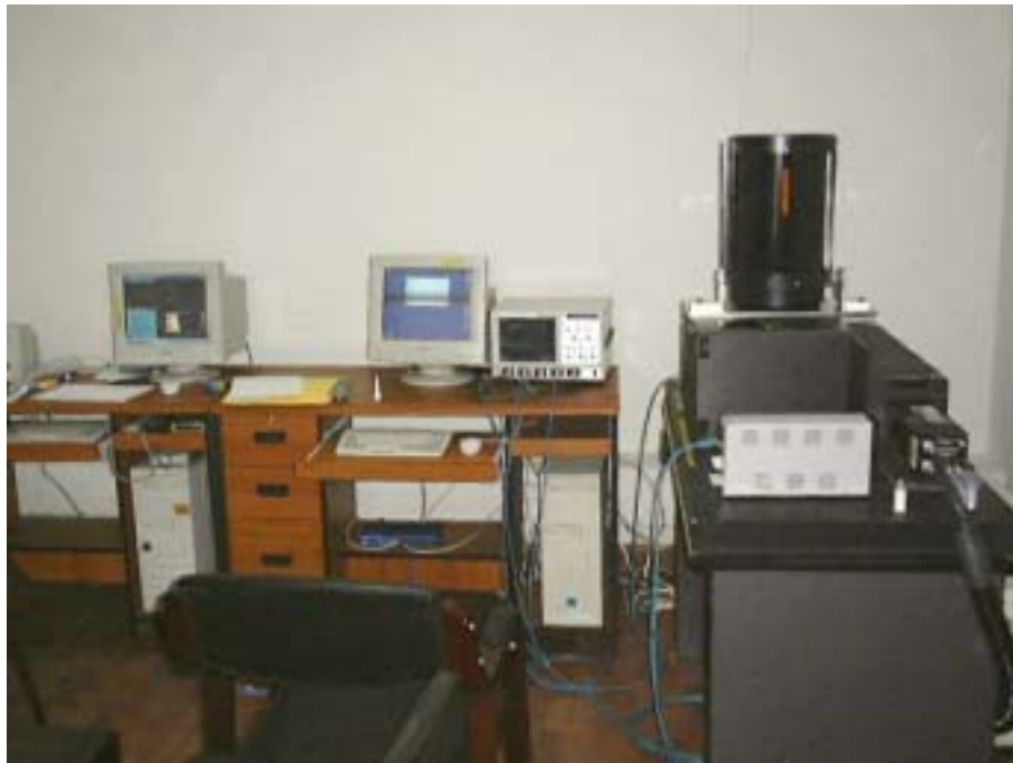
口絵 - 3 北京に設置されたライダー装置 (西川 2003)