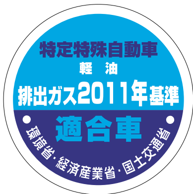
型式届出特定特殊自動車用 (改正基準に適合するもの)

改正基準に適合した特定特殊自動車に付する様式として、下記の3つが追加となります。