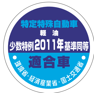
少数生産車用 (改正基準と同等性能のもの)