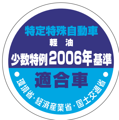
少数生産車用 (改正前の基準適合車)