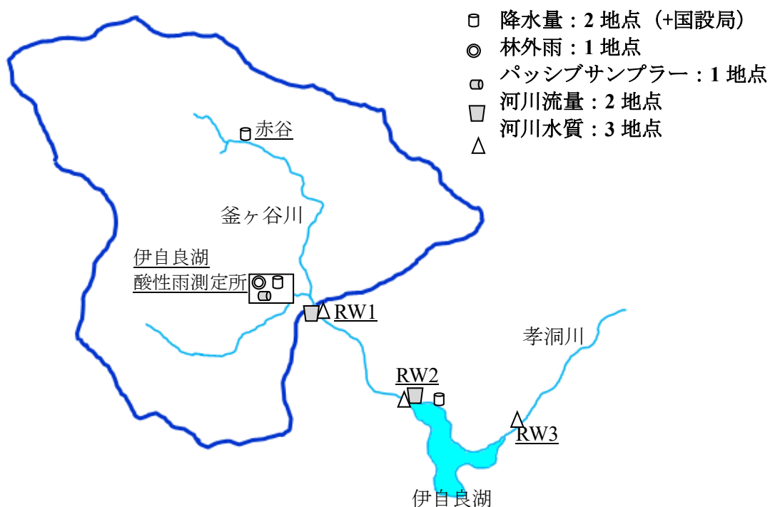
図1 令和2年度伊自良湖集水域モニタリング装置配置図