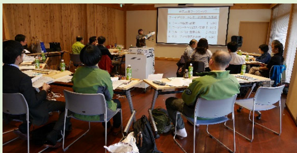
自然災害とビジターセンターの 関係をテーマにした意見交換会@熊本