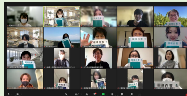
ユース世代、環境NPO、環境省職員が 参加した環境白書を読む会@オンライン