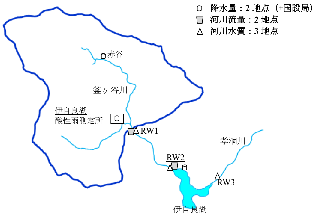
図1 令和6年度伊自良湖集水域モニタリング装置配置図

注：太線内は、物質収支解析を行った釜ヶ谷川の集水域を示す。総沈着量の推計には、酸性雨測定所における湿性・乾性沈着データを用いた。酸性雨測定所には同位体測定用の濾過式降水捕集装置も設置（2024年度で終了）。