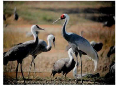
ナベツル・マナヅル