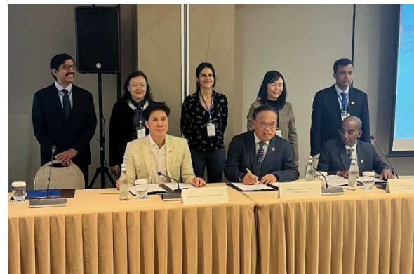
シンガポール・トルコ (左)、シンガポール・タイ・スリランカ (右) 相互認証締結式