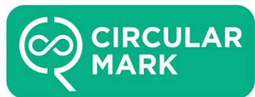
サーキュラーマーク

環境ラベルと GPP は、国家アジェンダである「BCG（バイオ・循環型・グリーン）経済モデル」政策と密接に連動している。特にサーキュラーエコノミーの推進において環境ラベルは重要な役割を果たし、TEI はこれに関連して廃棄物を原材料として再利用する製品のための「サーキュラーマーク」も新たに導入した。さらに、タイ政府が掲げる 2050 年ネットゼ