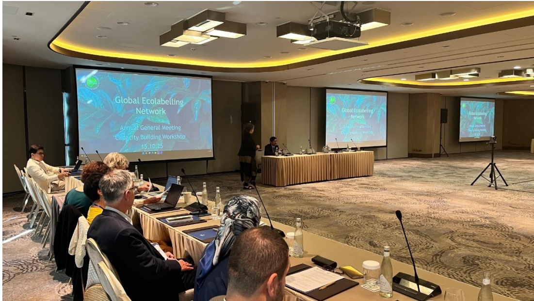
AGM 2 日目の様子