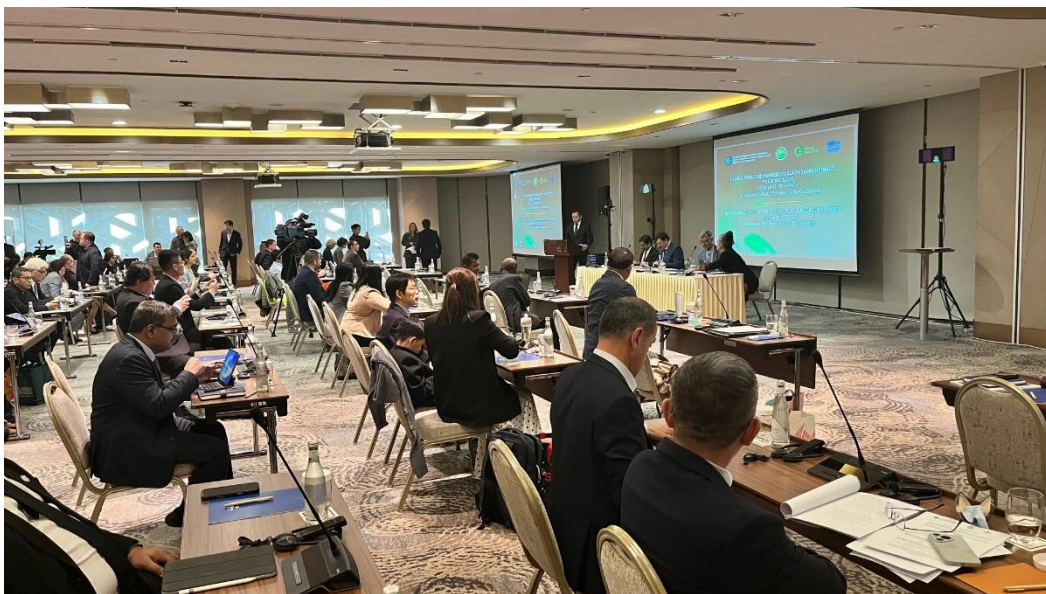
AGM 1 日目国際セミナーの様子

発表者はオンラインによる発表を行う予定であったが、本人の体調不良により本セッションは割愛された。