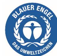
ブルーエンジェル

ブルーエンジェルは、1978年に世界で初めて開始されたISO14024に基づくエコラベル（旧称：タイプI環境ラベル）である。そのロゴデザインは、国連環境計画（UNEP）のロゴをモチーフとしている。2026年1月現在、認定対象は紙製品、家具、塗料、建材、電子機器に加え、カーシェアリング等のサービス分野まで多岐にわたる。これまでの認定実績は、101の商品カテゴリに対し、約65,000の製品・サービス（約1,600社）に達している。