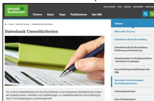
環境関連調達基準データベース