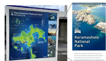
QRコードリンク先に多言語解説ページを作成