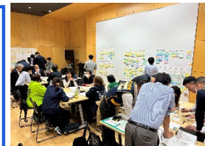
ペット同行避難訓練の支援