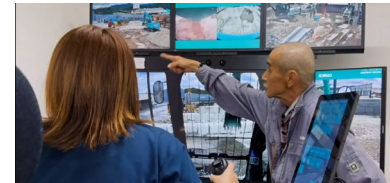
高度な技術を支える人材育成