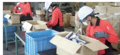
外国人材による人手不足対策