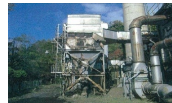
<老朽化施設等の更新>