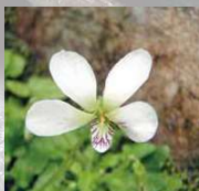
アマミシズレ (IUCN、環境省の両レッドリストに掲載)

世界遺産登録区域の面積は、日本の国土面積の 0.5% に満たないにも関わらず、日本の動植物種数に対して極めて大きな割合を占める種が生息・生育しています。例えば、維管束植物は 1,819 種（日本全体の 26%）、陸生・陸水性の脊椎動物は約 740 種（約 57%）、そして約 6,150 種（約 21%）の昆虫類が生息・生育しています。これらのなかには、IUCN レッドリストに掲載されている世界的な絶滅危惧種 95 種のほか、環境省のレッドリストに掲載されている 540 種以上の絶滅危惧種が含まれます。また、ここでしか見られない固有種が数多く分布しています。特に、陸生哺乳類では 62%、陸生爬虫類では 64%、両生類では 86% と極めて高い固有種率を示しており、サワガニ類はすべてこの地域の固有種です。このように、生物多様性の保全にとって極めて重要な地域となっています。