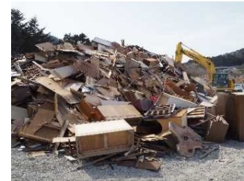
片付けごみの収集・運搬及び処分

災害等廃棄物処理事業費補助金を活用して行う以下の事業について、既存基金制度の枠組みを活用し支援。