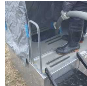
仮設トイレのし尿収集・運搬及び処分