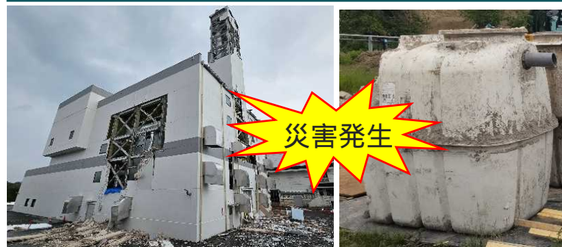
被災した廃棄物処理施設