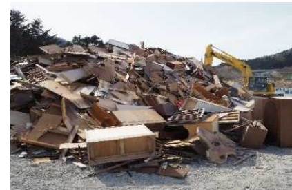
片付けごみの収集・運搬及び処分