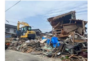
損壊した家屋等の解体、がれきの収集・運搬及び処分