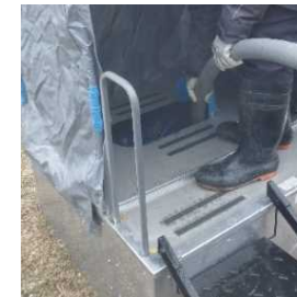
仮設トイレのし尿収集・運搬及び処分