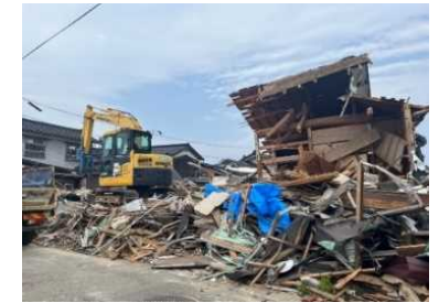
損壊した家屋等の解体、がれきの収集・運搬及び処分