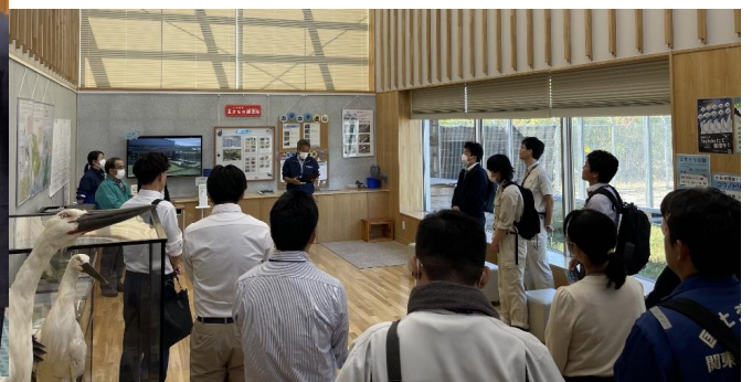
鴻巣市コウノトリ野生復帰センター天空の里の視察 (令和5年度 担当者会議)