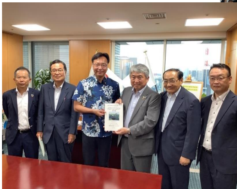
国定勇人 環境大臣政務官への要望書の提出 (令和5年8月1日)