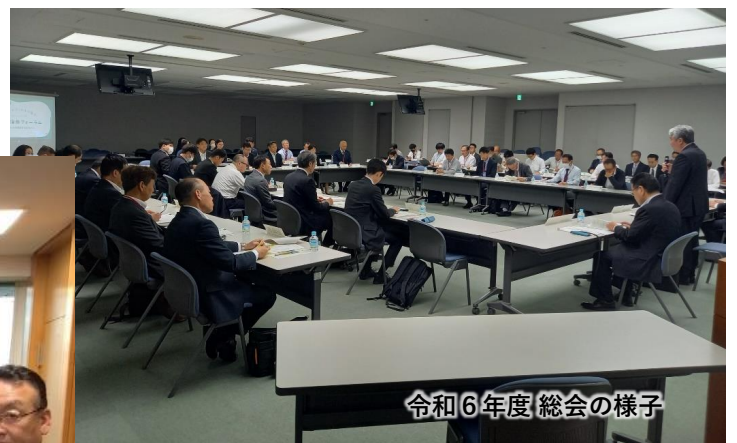
令和6年度総会の様子