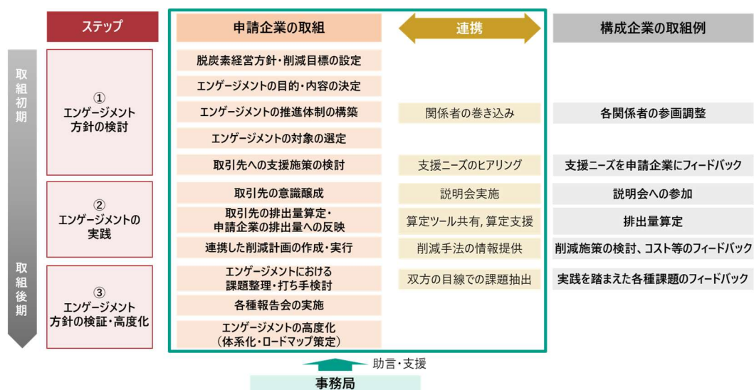
想定される申請企業と構成企業の取組内容（一例）

申請企業は、申請企業のVC排出量削減のために、構成企業（取引先企業）に対して行うエンゲージメントの取組を実施する。事務局は申請企業の取組実施に際して専門的助言や課題整理等の支援を行う。申請企業が行うエンゲージメントの例としては、構成企業の意識醸成や排出量算定支援、再生可能エネルギーの共同購買などの削減手法の検討、排出量データの共有・連携等が挙げられる。申請企業から構成企業に対するエンゲージメントや構成企業の取組内容は、一例として以下を想定しているが、申請企業や構成企業のこれまでの取組状況や要望を踏まえて、その一部を重点的に実施するなど個別に調整する。