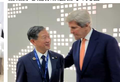
米・ケリー特使との意見交換