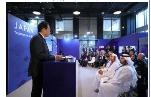
岸田総理がAction to Zero led by Japan and UAEを発信