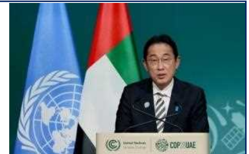
世界気候行動サミットで演説を行う岸田総理