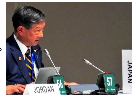
緩和野心閣僚級会合での発言