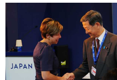
日豪でブルーカーボンイベントを共催