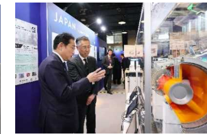
岸田総理がAZECプロジェクト等を発信