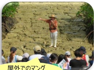
屋外でのマングローブ観察会