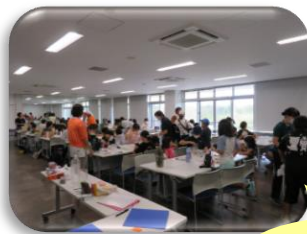
マングローブなんでもしらべ隊!!