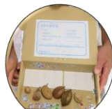
種子を使った工作