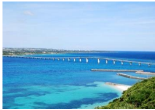
伊良部大橋（2015年1月開通） 全長約3,540m 無料で渡れる橋としては日本最長

調査対象地域：宮古島市 現参加者数（子ども）：788名（2023年11月末時点）