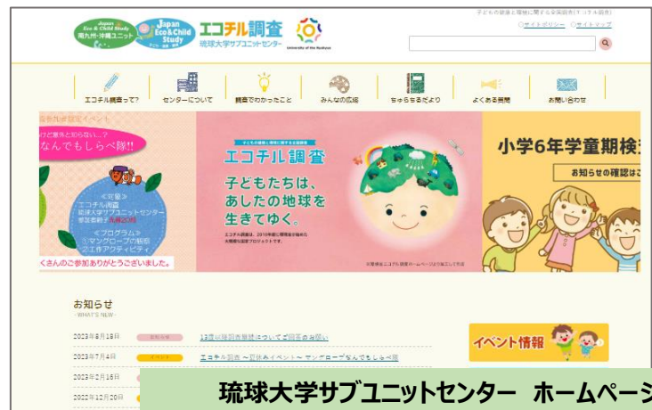
琉球大学サブユニットセンター ホームページ http://www.ecochild.med.u-ryukyu.ac.jp/

ホームページにて、イベントなどの活動状況や調査に関するお知らせを発信しています。