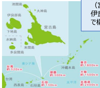
沖縄本島と宮古島の位置関係

宮古島市は、大小6つの島（宮古島、池間島、来間島、伊良部島、下地島、大神島）で構成されている。