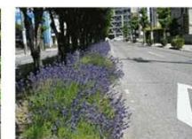
ラベンダー香る並木道