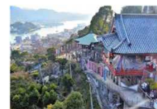
山々にこだまする鐘の音