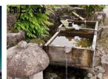
水路のせせらぎの音