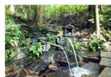
ホテルの里の水辺保全