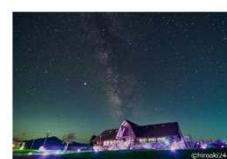
星空観察を通じた星空の保護