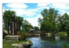
豊かな水辺の活用