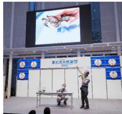
フォーラム・東京湾の窓 PT 活動