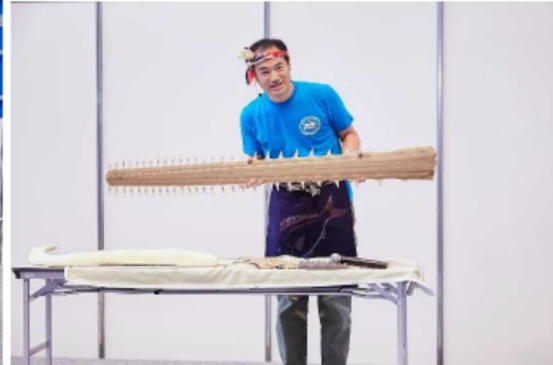
東京湾にいるモンスター