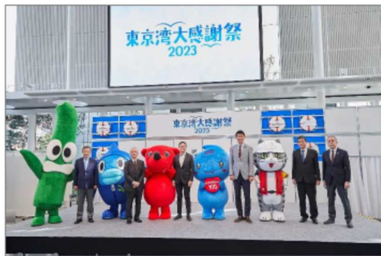
セレモニー出席者とマスコットキャラクター