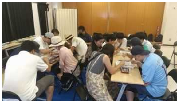
7月29日：金沢八景－東京湾アマモ場再生会議、種子選別