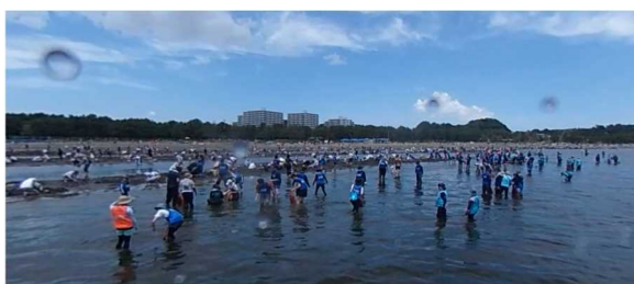
6月4日：三菱電機（株）主催、花枝採取