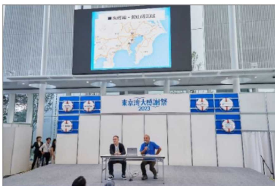
地元自慢・館山市