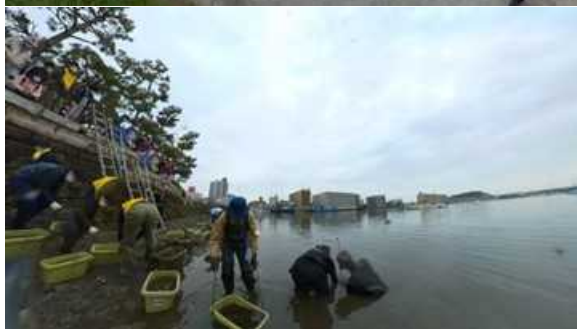
4月22日：金沢八景ー東京湾アマモ場再生会議、アマモ移植会