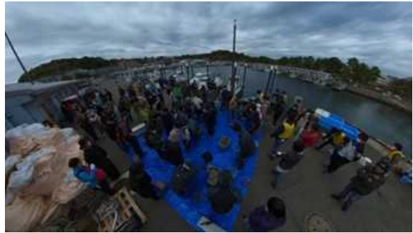
10月3日： マルハニチロ（株）、 東京ガス（株）、種子選別