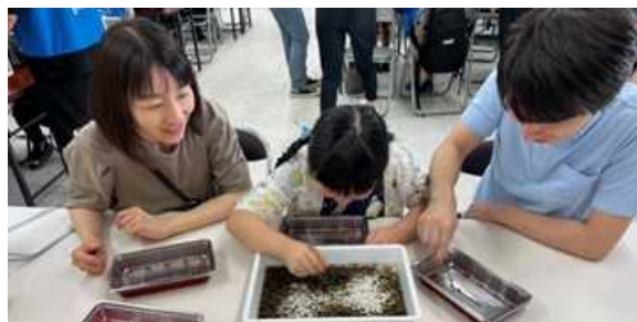
7月30日：日本テレビ、種子選別