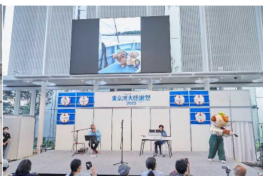
地元自慢 東京湾岸自治体