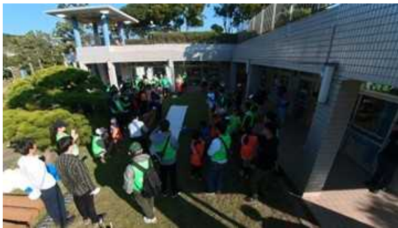
11月11日： 金沢八景ー東京湾アマモ場 再生会議、苗床づくり