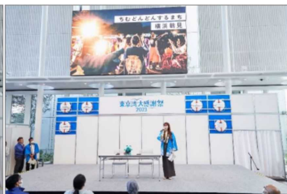
地元自慢 横浜市 鶴見区