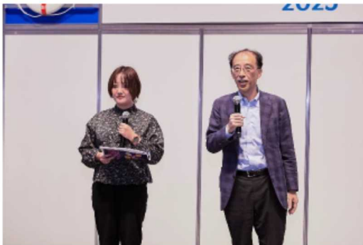
東京湾 NPO 活動 CNAC