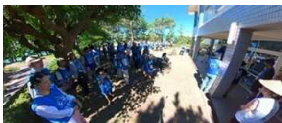
6月3日：マルハニチロ（株）、花枝採取