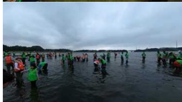
5月20日：セブン-イレブン記念財団、花枝採取