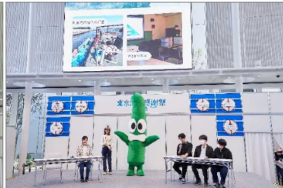
学生の考える東京湾 リレートーク