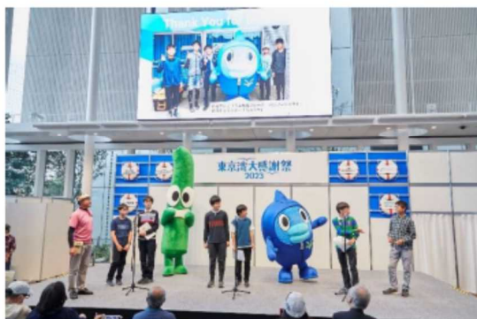
筑波大学附属駒場中学生によるアマモなどの取材発表