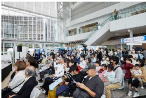
多くの入場者の方にステージを見ていただきました