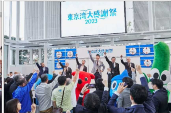
オープニングセレモニー