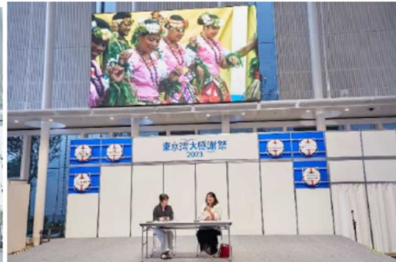
海のSDGs 2024 プレ企画