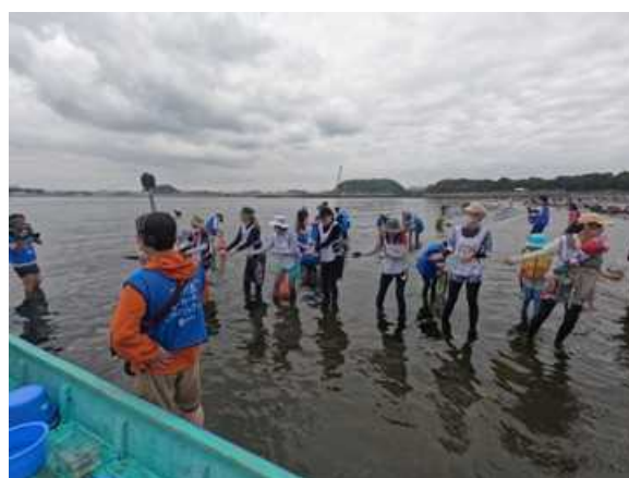
5月21日：東京ガス（株）、日本テレビ、花枝採取