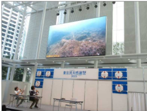
東京港お台場の水中は今! 東京港水中生物研究会