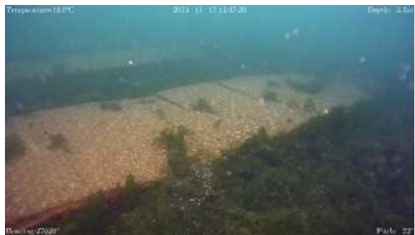
11月4日： セブン-イレブン記念財団、 種子選別