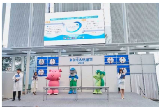
東京 WONDER 下水道