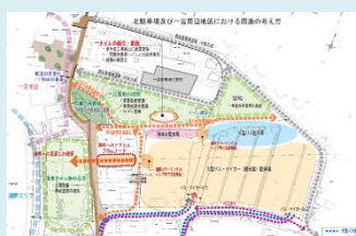
自然と調和した滞在環境の整備

集団施設地区など利用拠点の面的な再生・上質化のため廃屋の撤去やその場所への新たな投資、利用者目線の機能充実、景観デザインの統一、電線の地中化等