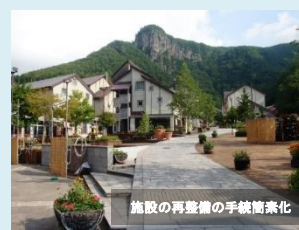
施設の再整備の手続簡素化