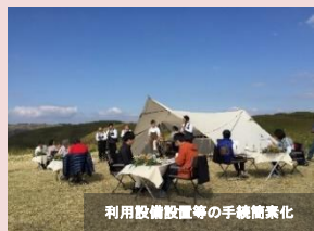
利用設備設置等の手続簡素化