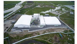
浪江町 仮設焼却施設