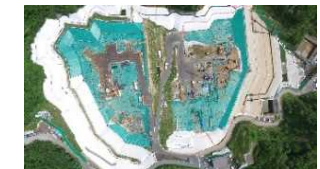
特定廃棄物埋立処分場