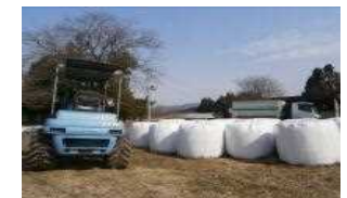
農林業系廃棄物(稲わら、牧草等)