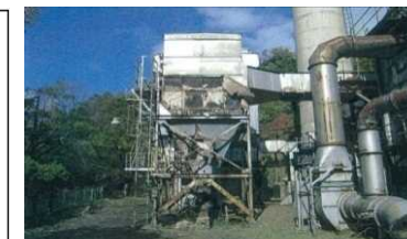
<老朽化施設等の更新>