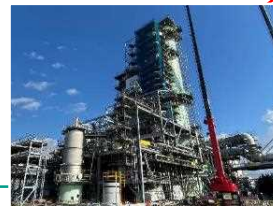
◆ CO 2 分離回収

苫小牧沿岸域にて実施される海底下CCS実証事業や新たなCCS事業が、環境と調和した上で迅速にかつ適切に実施されるよう、BATを活用した適正なモニタリングの在り方について、環境負荷が少なく自然再興(ネイチャーポジティブ)、コスト低減等に資する物理(電磁)探査システムや環境DNAにおけるモニタリング技術などの開発、検討を行う。