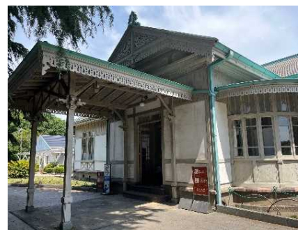
旧洋館御休所（国の重要文化財）