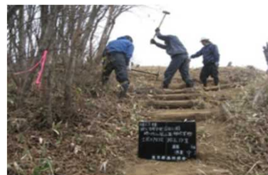
登山道の維持・補修