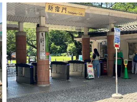
キャッシュレス設備導入