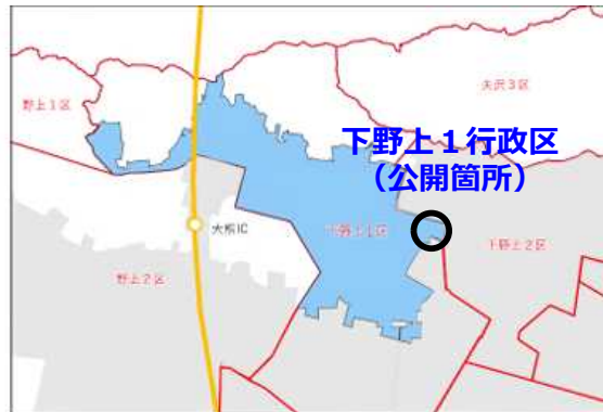
※特定帰還居住区域復興再生計画（令和5年9月 福島県大熊町より）