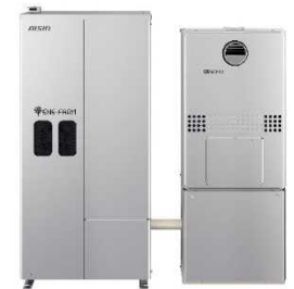
家庭用燃料電池（エネファーム）