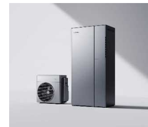
ハイブリッド給湯機