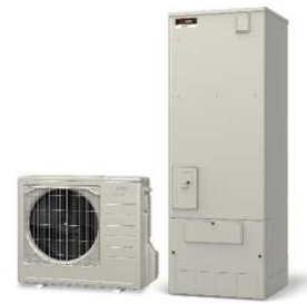
ヒートポンプ給湯機（エコキュート）

※高効率給湯器の導入と併せて蓄熱暖房機または電気温水器を撤去する場合、加算補助。