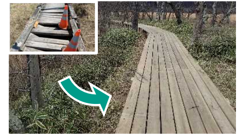
老朽化木道の改修等