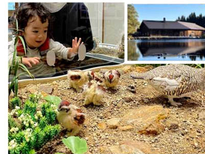
ビジターセンター(拠点施設)整備