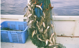
外来魚の集中駆除

外来魚の生息量は減少してきたものの、更なる対策の推進のため、多様な手法を組み合わせた防除を実施