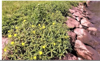
石組み護岸に生育したオオハナミスキンバイ

農地等での新たな生育の確認や石組み護岸やヨシ帯など機械駆除困難区域への対応が課題