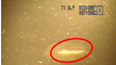
全層循環の未完了に伴う北湖深水層の負酸化によるイササの死亡(令和2年9月)