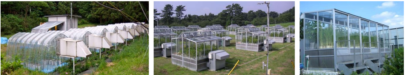
図 4 グリーンハウス型のフィールドチャンバー (東京農工大学, 東京都八王子市) (左) とガラス温室型のオープントップチャンバー (中央: 電力中央研究所, 群馬県前橋市; 右: 埼玉県環境科学国際センター, 埼玉県加須市)