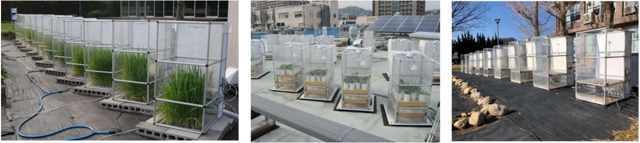
図 3 日本で利用されている小型のオープントップチャンバー (OTC) の一部。左: 埼玉県環境科学国際センター (埼玉県加須市), 中央: 長崎大学 (長崎県長崎市), 右: 山梨大学 (山梨県甲府市). Heagle et al. (1973) が開発した OTC は円形の筒型でより大型である。