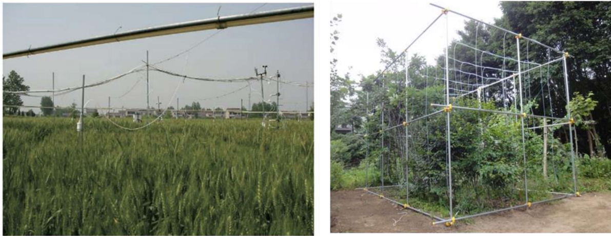
7 8 図 5 FACE 型のオゾン曝露システム. 左: 作物を対象としたシステム 9 (中国江蘇省) (Kobayashi, 2015). 右: 樹木を対象としたシステム 10 (北海道大学, 北海道札幌市). 11

1 ューブから CO 2 を放出して、群落全体を覆う大気中の CO 2 濃度を均一に上昇させるとい 2 う施設である。この施設をオゾン曝露に応用し、世界各地において、作物や樹木に対する 3 FACE 型のオゾン曝露システムが構築、利用されており (Morgan et al. , 2004; Karnosky et 4 al. , 2007; Tang et al. , 2011)、日本においても樹木を対象とした FACE 型のオゾン曝露シ 5 ステムが稼働している (図 5) (Watanabe et al. , 2013; Kobayashi, 2015)。 6