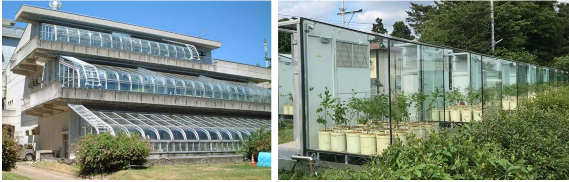
図 2 自然光型ファイトトロン. 左: 国立環境研究所 (茨城県つくば市), 右: 東京農工大学 (東京都府中市).

人工光型グロースキャビネットは、温湿度に加えて光強度や日長が再現可能な反面、電磁スペクトルが太陽光とは異なることや、植物と光源との距離の変化によって植物に届く光強度が変化する(牛島, 1978)。そのため、人工光型グロースキャビネットを用いたオゾン曝露実験で得られた結果を野外で生育する植物に対するオゾンの影響評価に直接適用することは難しい。これに対して自然光型ファイトトロンは、ガラスによる紫外線の吸収がもたらす光質の変化やフレーム等による光量の減衰があるものの、光条件は自然環境に近いいため、本装置を用いたオゾン曝露実験により、植物の成長や光合成に対する長期影響といった個体レベルでのオゾンの影響を評価することができる。そして、ファイトトロン内のオゾン濃度は制御可能であることから、自然光型ファイトトロンを複数台用意し、オゾン濃度のみが異なる環境で植物を栽培し、その成長影響を調べることで、オゾンの積算曝露量や積算吸収量に対する成長応答や収量応答を定量的に評価することができる。