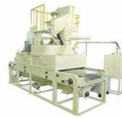
太陽光発電設備 リサイクル設備