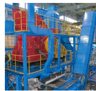
金属破碎・選別設備

・ 資源循環を促進するため、工程端材、いわゆる都市鉱山と呼ばれている有用金属を含む製品及び再エネ関連製品の再資源化を行うリサイクル設備の導入を支援する。