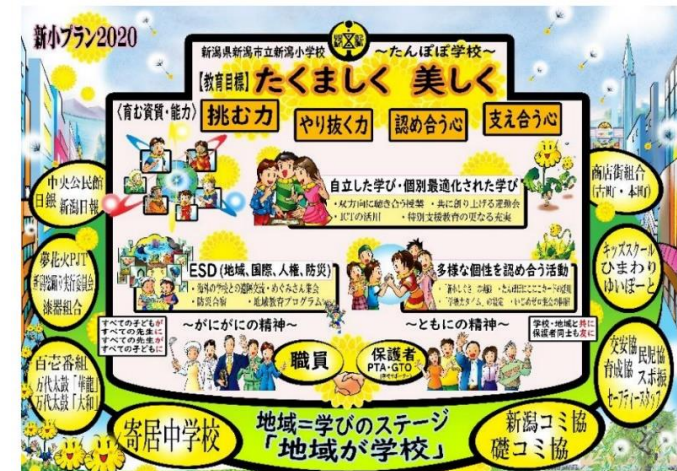
ESD推進のためのカリキュラム・デザインの三つの階層