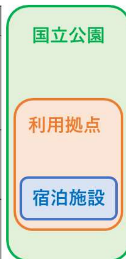
図1 各スケールにおける利用の高付加価値化の取組の例