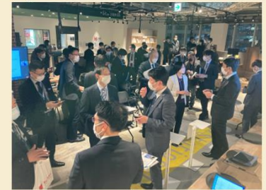
会合終了後の名刺交換

● 地域脱炭素マッチング会 (第2回) : 令和5年1月18日(水) 【主催】北海道地方環境事務所 【共催】(公財)北海道環境財団、 北海道環境パートナーシップオフィス 【協力】北海道