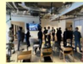
会合終了後の名刺交換

【講演企業】 ・京セラコミュニケーションシステム株式会社 (石狩市関係企業) ・北海道ガス株式会社 (上士幌町関係企業) ・鹿島建設株式会社 (鹿追町関係企業)