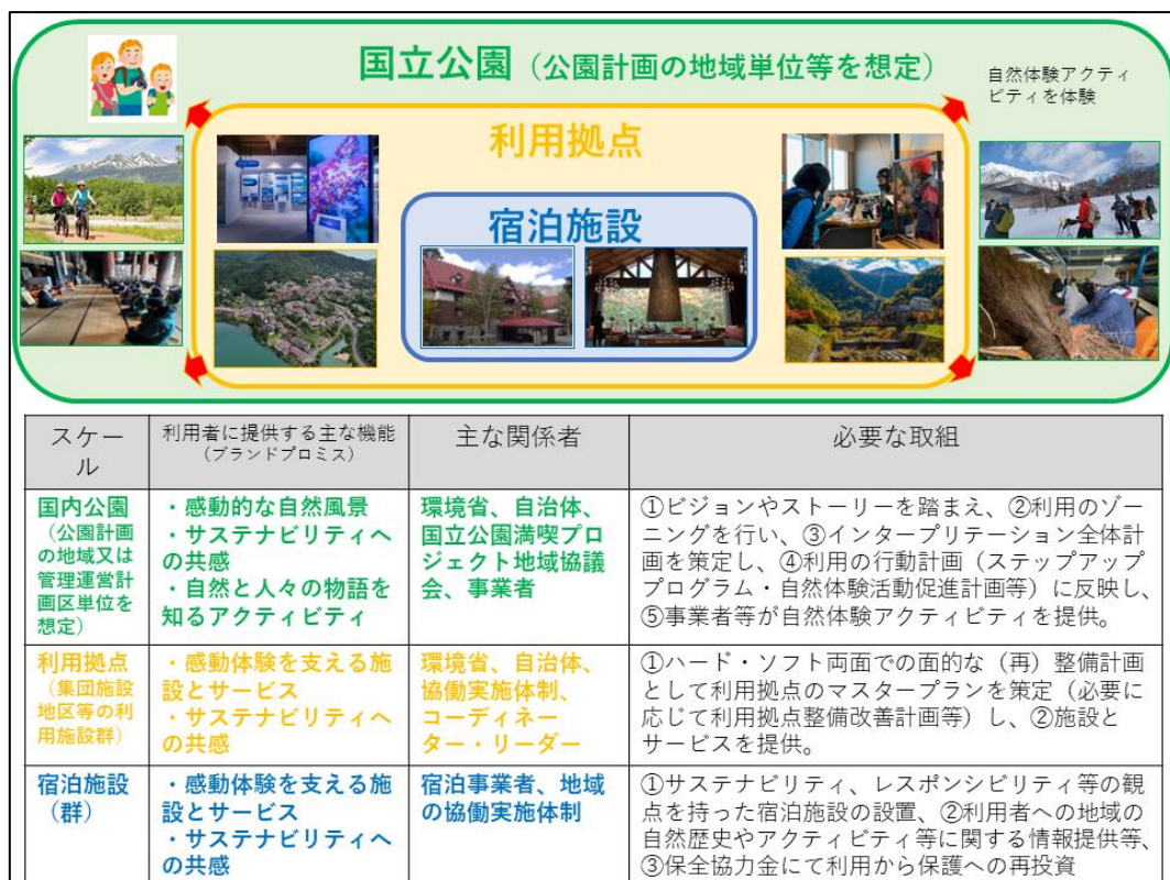
19 図1 各スケールにおける利用の高付加価値化の取組の例 20