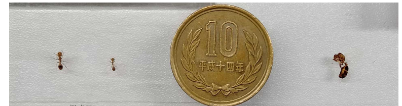
働きアリ 体長約2.5~6mm ヒアリの大きさ 女王アリ 体長約7~8mm