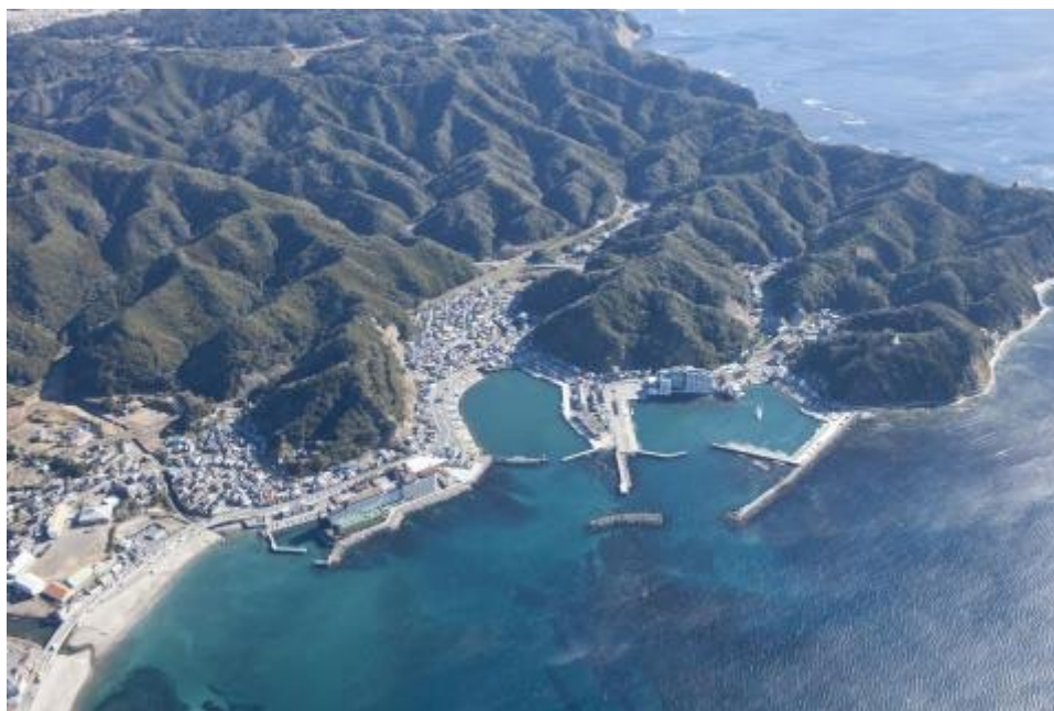
図 1-1 小湊漁港のしゅんせつ範囲

一方で、小湊漁港は、高波浪時の海浜流や波浪による土砂の流入により、港内及び航路に土砂が堆積しやすい環境である。現在、船舶の航行や岸壁を利用する船舶が安全に接岸するための水深確保が難しい状況となっており、漁業生産基地及び流通拠点としての役割に支障を来す状況となっている。