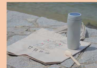
島内に設置した ウォーターサーバー& マイボトルイメージ