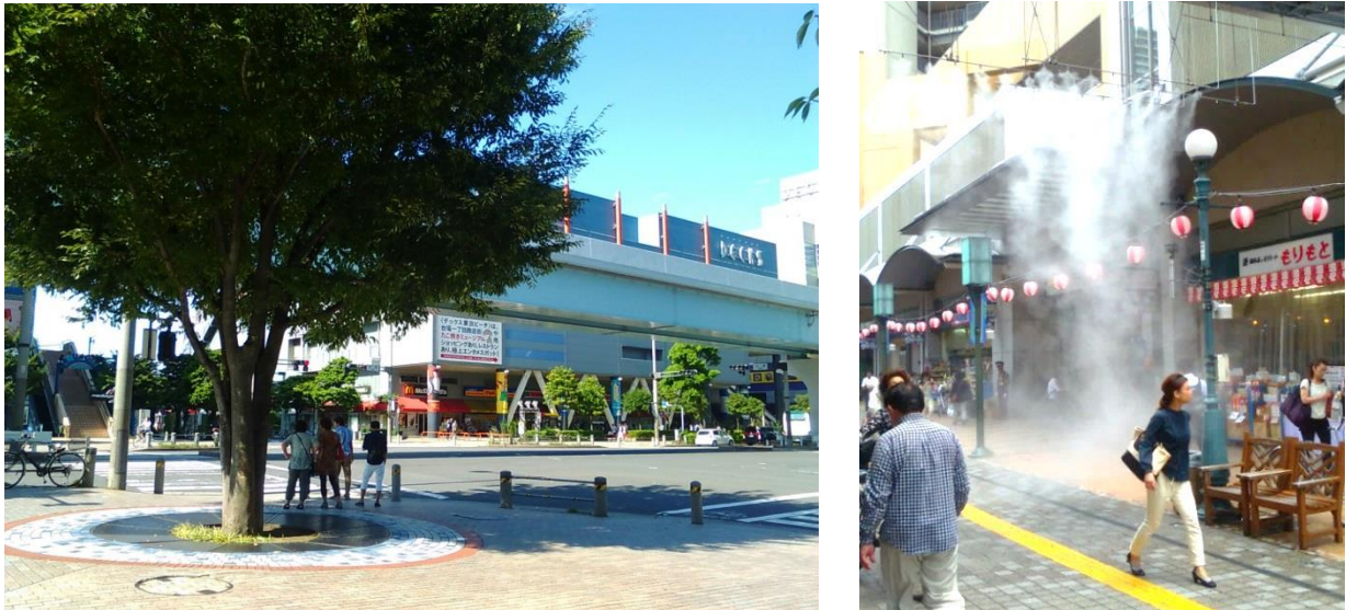
図 2 交差点近くの木陰（左）と商店街での微細ミスト対策（右）

これまでの暑さ対策は、個々に日傘をさす、打ち水をするなどのソフトな取り組みを中心に行われてきました。しかし、気候変動による気温上昇は今後も一定程度進むことが予測されており、まちなかの暑さはより一層、厳しさを増す可能性があります。そのため、まちなかの暑さ対策にも積極的に取り組んでいくことが重要となります。