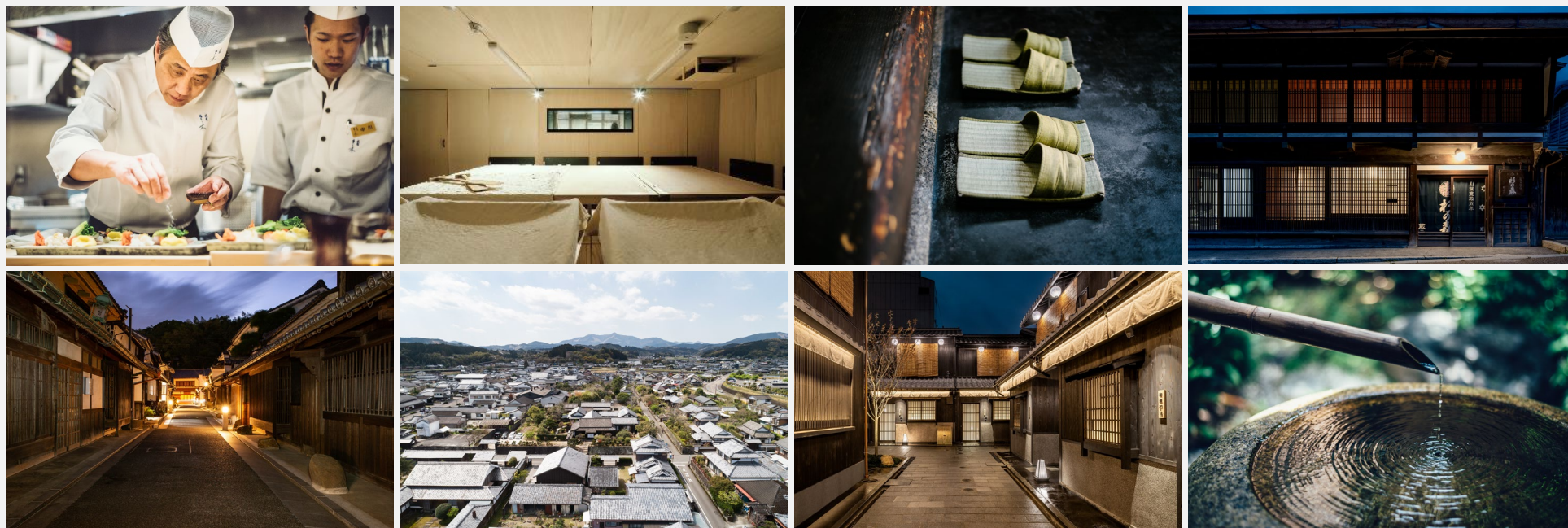
※Kirakuがこれまで取り組んできた（又は取り組み中の）旅館・古民家・事業再生案件の事例写真。

この度は、Kirakuとハイアット ホテルズ コーポレーションとの合弁により『現代の旅館』の経営・運営のプラットフォーム化に取り組むことになりました。