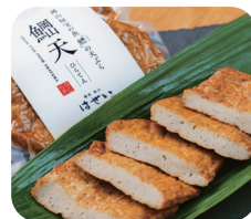
岡山の里海の幸の代表魚である ヒラのじゃこ天