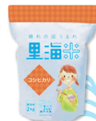
晴れの国うまれ 里海米「コシヒカリ」 無洗米 2kg