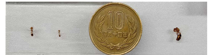
働きアリ 体長約2.5~6mm ヒアリの大きさ 女王アリ 体長約7~8mm