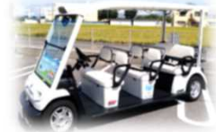
グリーンスローモビリティ