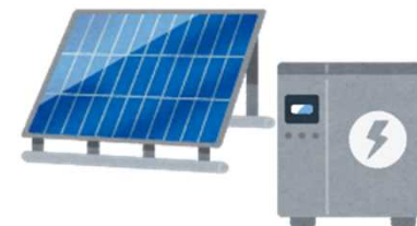
再生可能エネルギー設備

お問合せ先： 環境省環境再生・資源循環局廃棄物適正処理推進課浄化槽推進室 電話：03-5501-3155