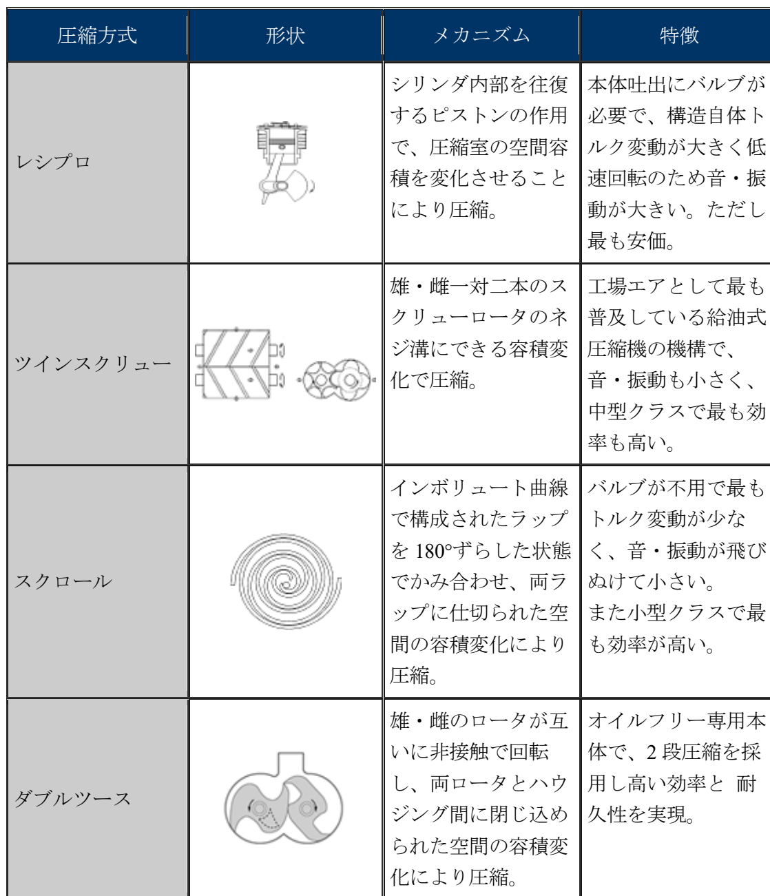
図 2 圧縮機の圧縮方式、形状、メカニズム

また、圧縮方式ごとの圧縮原理を鑑みても、回転式（スクリー式、スクロール式）の圧縮機は往復式（レシプロ式）と比較すると、往復動部分、不釣合部分が無いいため回転体のバランスが良く、加振力が小さいため低振動であることが知られている。（図 2）。