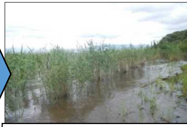
造成後、成長するヨシ帯