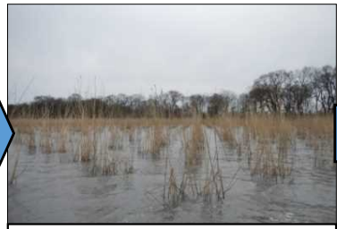
造成、ヨシ植栽を実施