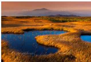
鳥海山麓の湿地群

標高2,236mの独立峰である鳥海山麓にある「鳥海山獅子ヶ鼻湿原植物群落及び新山溶岩流末端崖と湧水群」、また沿岸部の田園地帯に小さな島々が点在する「象潟(通称九十九島)」は、いずれも国の天然記念物に指定されている。環境省の重要湿地に指定されている湿地群も存在する。本地域は自然と調和した里地として鳥類の生息に適している。