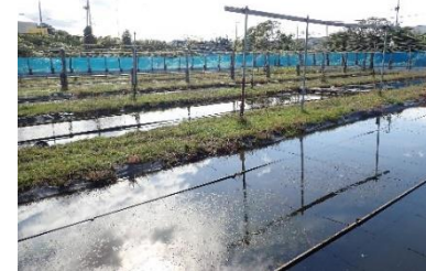
休耕田を利用したドジョウの自然養殖場