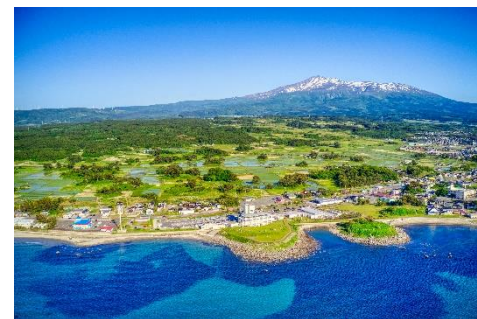
鳥海山とにかほ市の景観