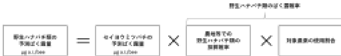
図2 野生ハナバチ類の予測ばく露量（接触ばく露量・経口ばく露量共通）

「対象農薬の使用割合」は、水産動植物の被害に係る評価で適用している農薬の普及率（水田10%、非水田5%）を使用割合とする。