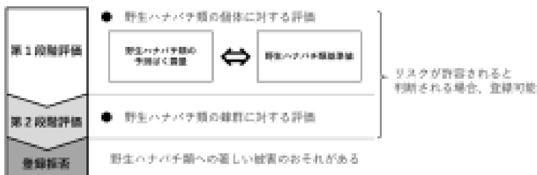
図3 野生ハナバチ類のリスク評価