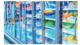
冷凍冷蔵ショーケース