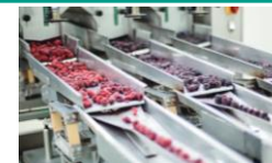
食品製造ラインのフリーザー